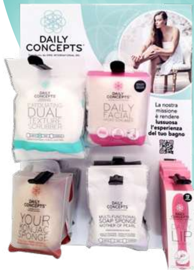
Espositore da banco DAILY CONCEPTS | DISPLAY 2