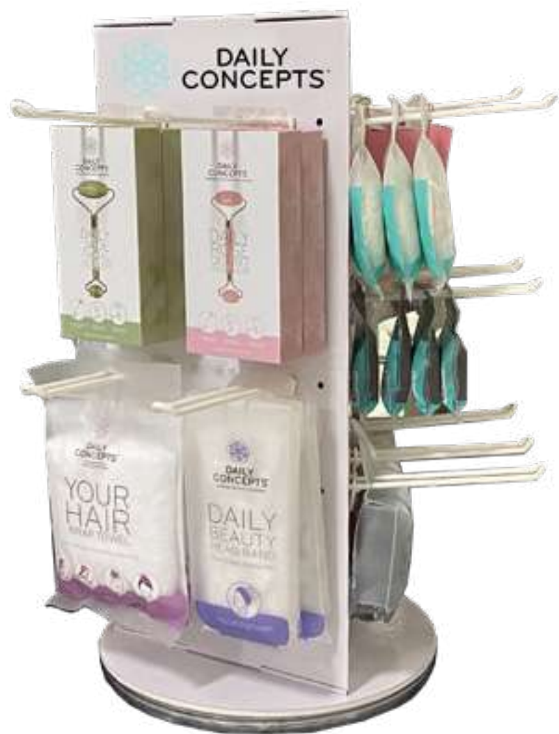
Espositore da banco girevole DAILY CONCEPTS | DISPLAY 1