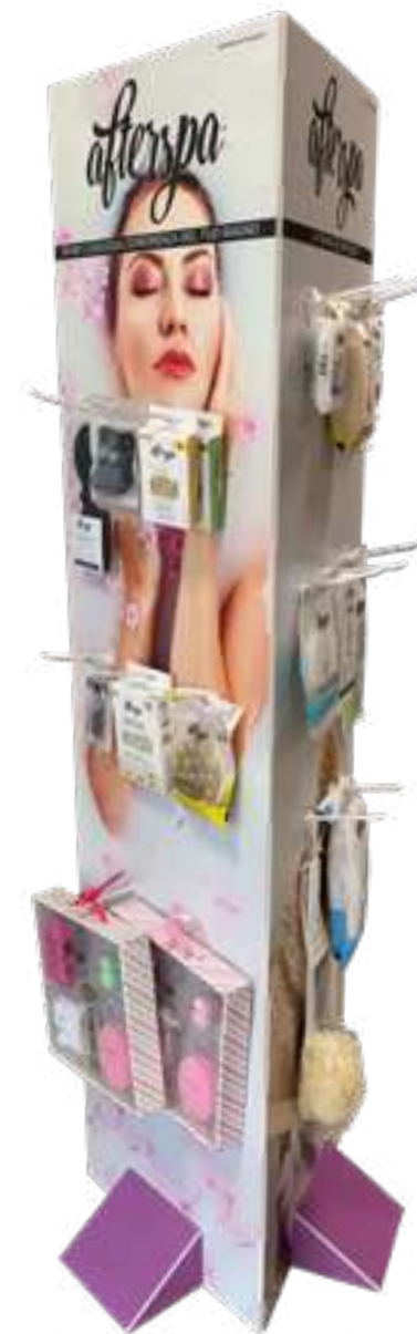
Espositore da terra AFTERSPA