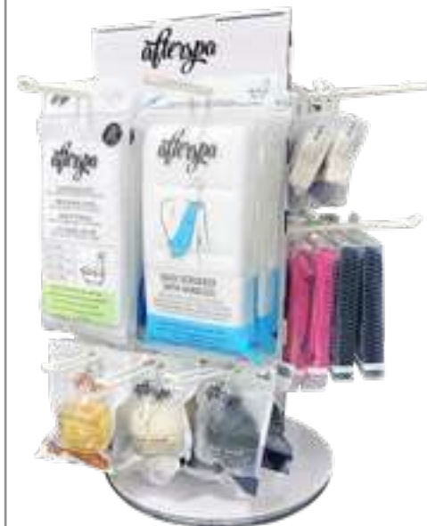
Espositore da banco AFTERSPA