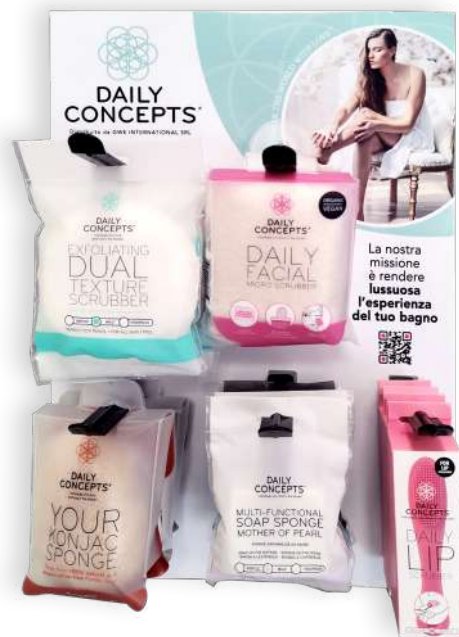
Espositore da banco DAILY CONCEPTS DISPLAY 1