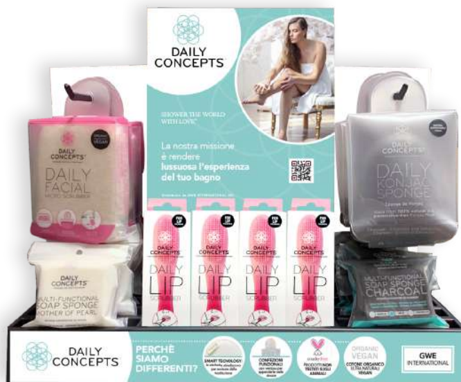
Espositore da banco DAILY CONCEPTS DISPLAY 2