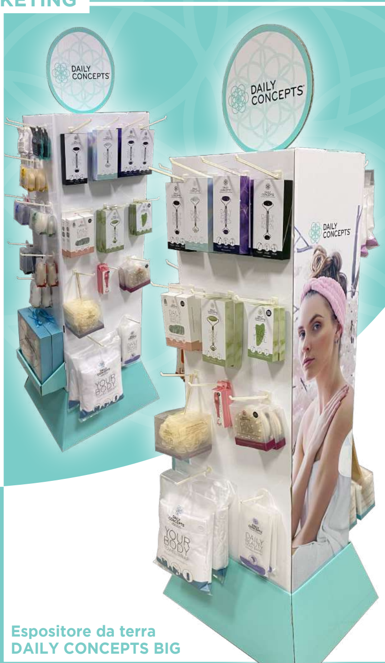
Espositore da terra DAILY CONCEPTS BIG