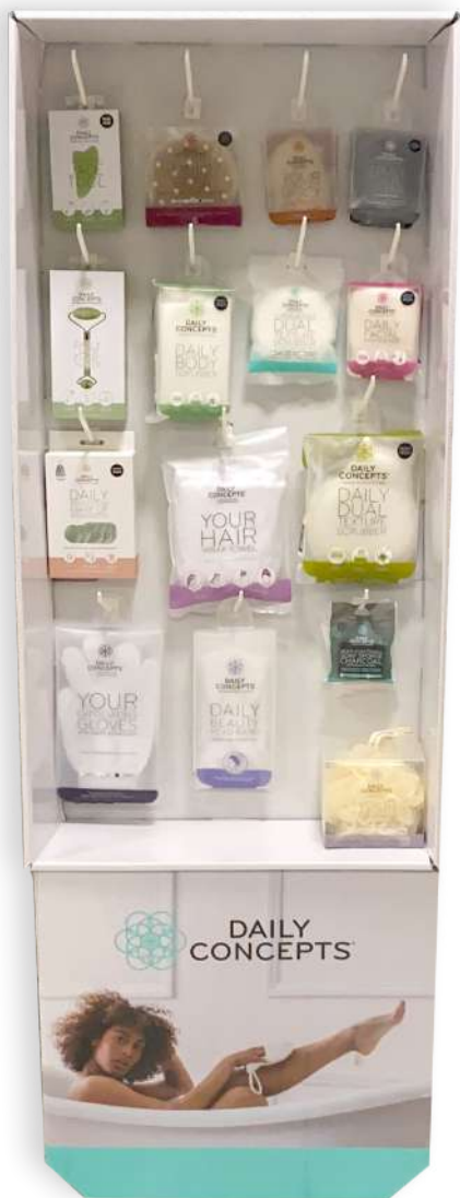
Espositore da terra DAILY CONCEPTS FLOOR