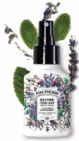
lavender PEPPERMINT lavanda + menta piperita + agrumi Disponibile in: 10mL • 2oz • 4oz