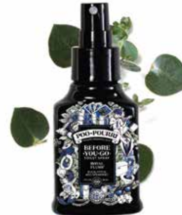
royal FLUSH® eucalipto + menta verde Disponibile in: 10mL • 2oz • 4oz