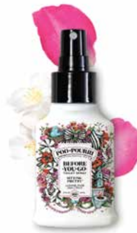
sitting PRETTY® gelsomino + rosa + agrumi Disponibile in: 2oz • 4oz