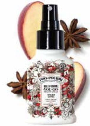
spiced APPLE mela + pecan + agrumi Disponibile in: 2oz • 4oz