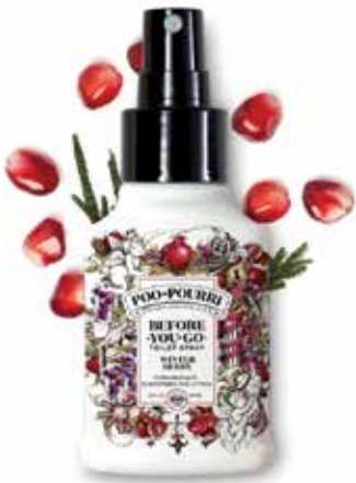
winter BERRY pomegranate + evergreen + citrus Available in: 2oz • 4oz