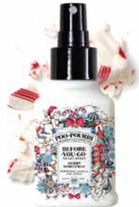
merry SPRITZMAS® menta piperita + vaniglia + agrumi Disponibile in: 2oz • 4oz