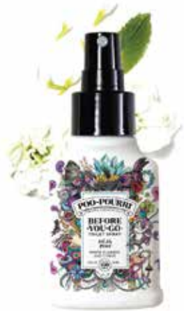
deja Poo fiori bianchi + agrumi Disponibile in: 2oz • 4oz