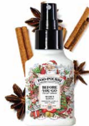
secret SANTA® cinnamon + vanilla + citrus Available in: 2oz • 4oz