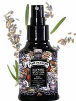
doo DISGUISE® lavanda + tea tree + agrumi Disponibile in: 2oz • 4oz