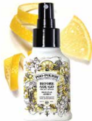
original CITRUS limone + bergamotto + citronella Disponibile in: 10mL • 2oz • 4oz • 8oz • 16oz