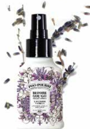
lavander VANIGLIA lavanda + vaniglia + agrumi Disponibile in: 10mL • 2oz • 4oz • 8oz • 16oz