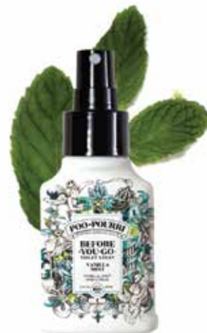
vanilla MINT vaniglia + menta + agrumi Disponibile in: 10mL • 2oz • 4oz