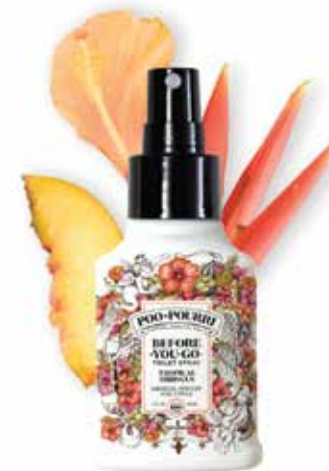
tropical HIBISCUS ibisco + albicocca + agrumi Disponibile in: 10mL • 2oz • 4oz