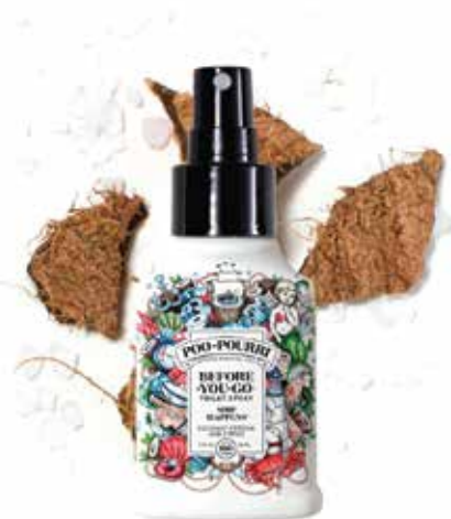
ship HAPPENS® cocco + fresia + agrumi Disponibile in: 2oz • 4oz